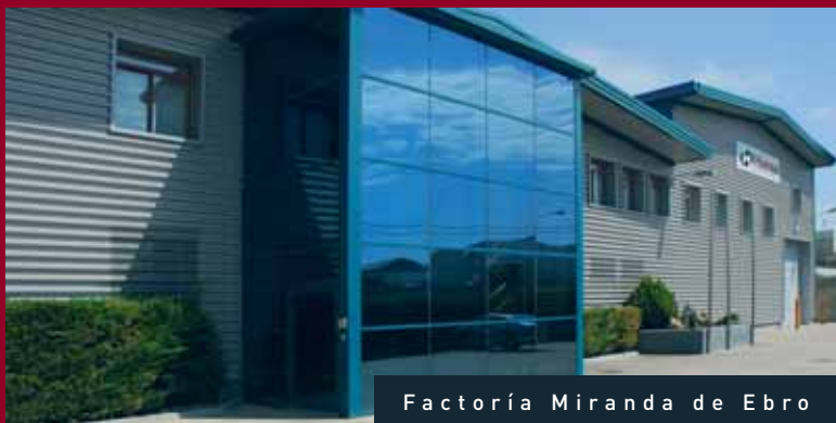
Factoría Miranda de Ebro