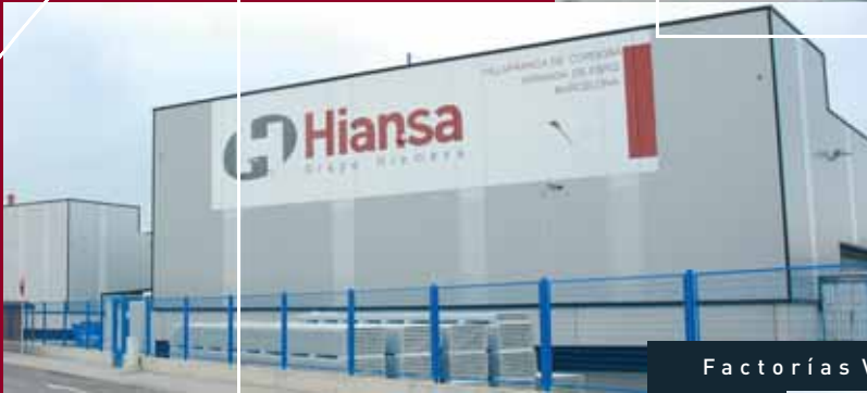
Factorías Villafranca de Córdoba